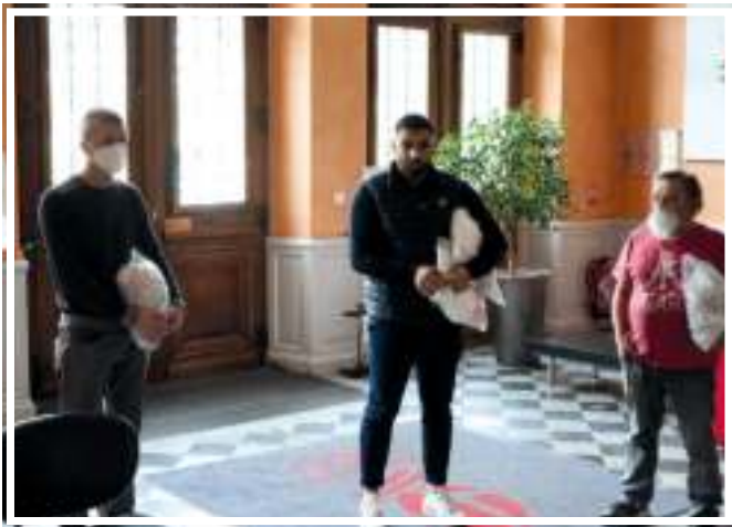
Vendredi 24 avril - L'entreprise albertvilloise, BRAVE, a généreusement offert 600 masques à la Ville.