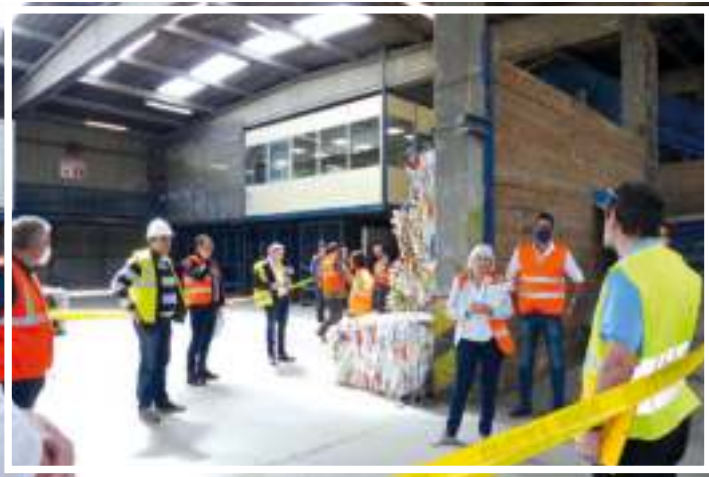
Jeudi 16 avril - Réunion au centre de tri en vue du déconfinement.