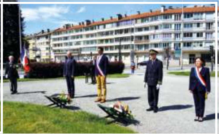
Commémoration du 8 mai 1945 - Hommage aux combattants et résistants de la France Libre.