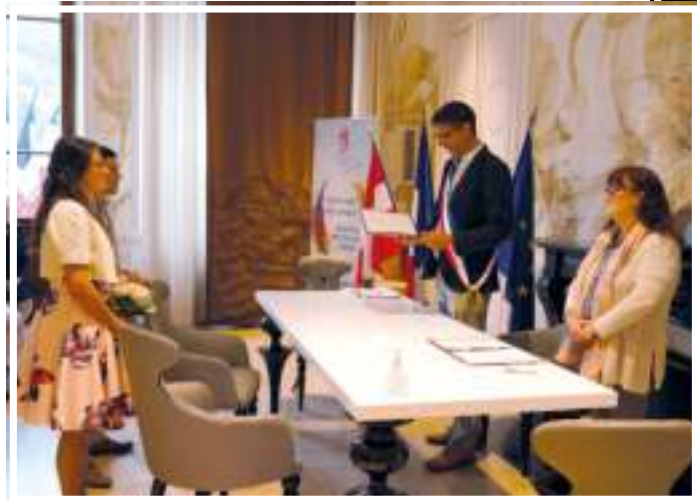
Samedi 13 juin : Les célébrations de mariage reprennent en mairie.