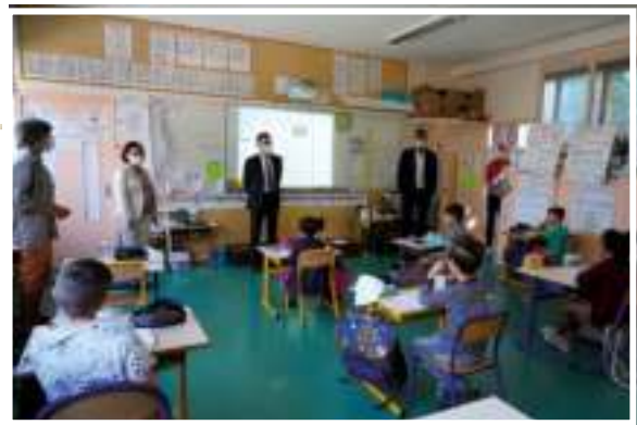
Jeudi 14 mai - 25 % des petits Albertvillois ont repris le chemin des écoles et groupes scolaires.