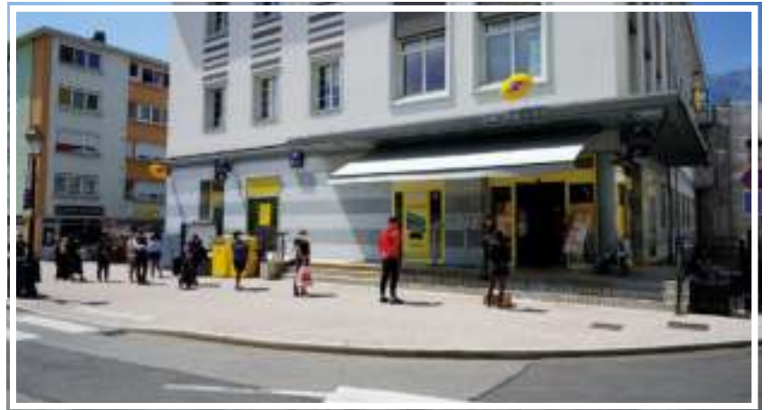
La distanciation sociale : une nouvelle habitude à respecter.