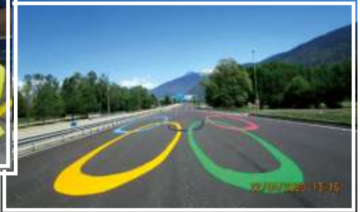
Mercredi 22 avril - Les anneaux olympiques sont de retour sur l'A 430, au niveau du péage de Sainte-Hélène-sur-Isère.