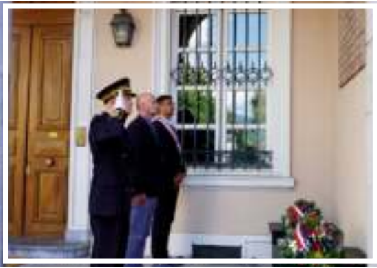
Mercredi 27 mai - Hommage à Jean Moulin lors de la Journée nationale de la Résistance.