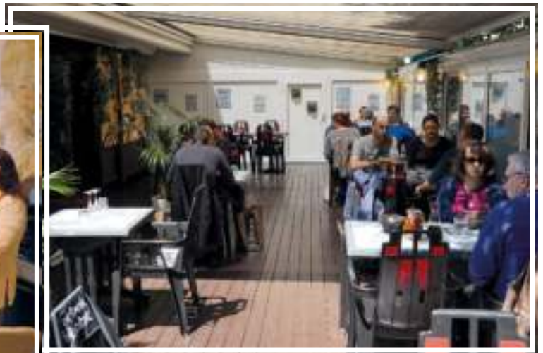
Mardi 2 juin : Réouverture des bars et restaurants après celle des commerces !