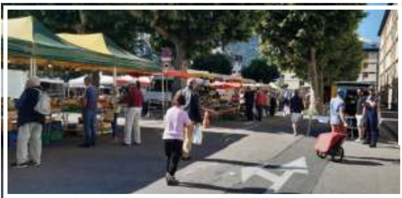
Adaptation des marchés pour préserver la sécurité sanitaire des exposants et de la clientèle.