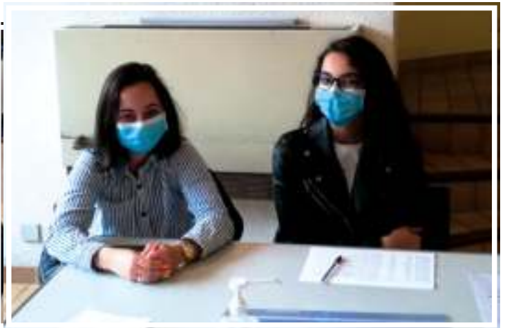
Merci à tous les bénévoles qui ont rendu possible la distribution des masques aux Albertvillois. Merci à la Région et à la Communauté d'agglomération Arlysère.