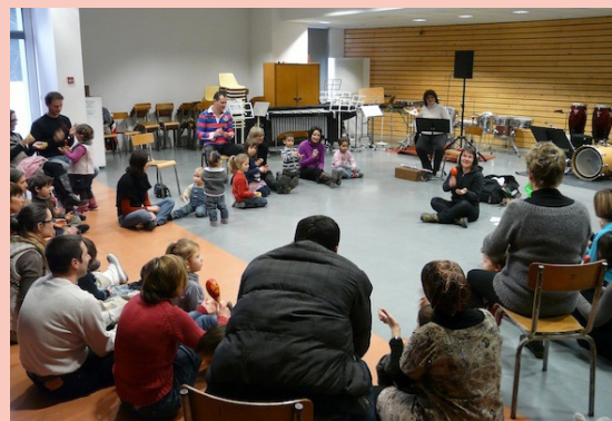
Atelier Parents - enfants - semaine de la Petite Enfance / Ugine