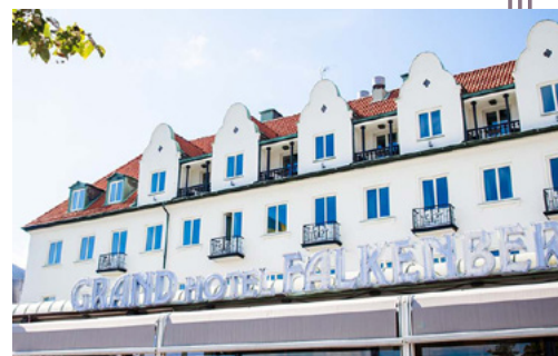
Grand Hotell i Falkenberg

Information: Martina Jönsson martina.jonsson@regionhalland.se 0733 - 90 16 52