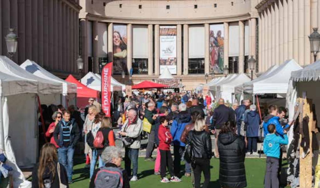
Photo de couverture : Le Grand Bivouac - Albertville