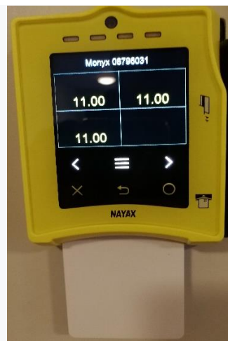
Her brukes CHIP på kort.