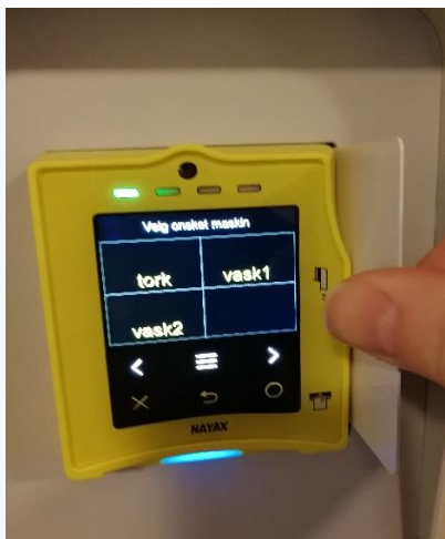
Her brukes magnetstripe.