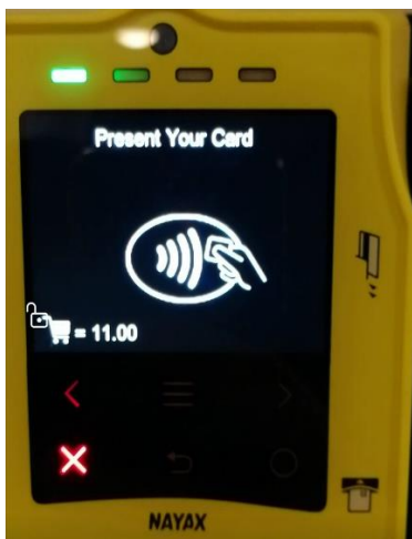
Terminal klar for betaling.

Maskinene er merket med Vask 2 (ikke i nr. 37), Vask 1 og Tork. Påse at maskinene er ledige før du starter betalingsløsningen. Trykk først på ønsket maskin på touchpanelet, følg instruksene videre.