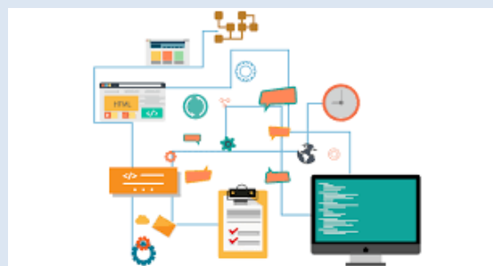
TRAJECT : Principes de bases

Diagnostic de la structure et adaptation de la base de données