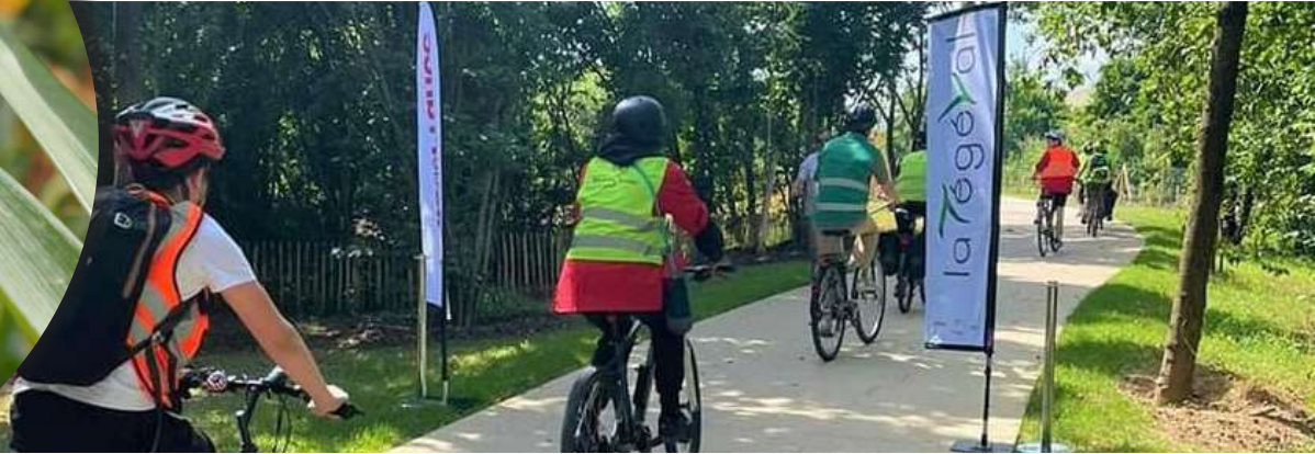
Inauguration d'une nouvelle portion de la Tégéval, le 21 mai 2022 à Pompadour