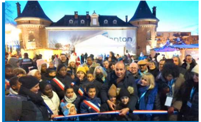
Inauguration du marché de Noël, jeudi 15 décembre dernier en présence de Monsieur le Maire Métin YAVUZ, de l'équipe municipale, des agents et des habitants. Un moment magique !

Vous le constatez, l'année 2022 fût riche et ce n'est ici qu'un résumé de tout ce que nous avons vécu ensemble. Gageons que 2023 le sera encore plus. Je vous souhaite à toutes et à tous une belle année 2023.