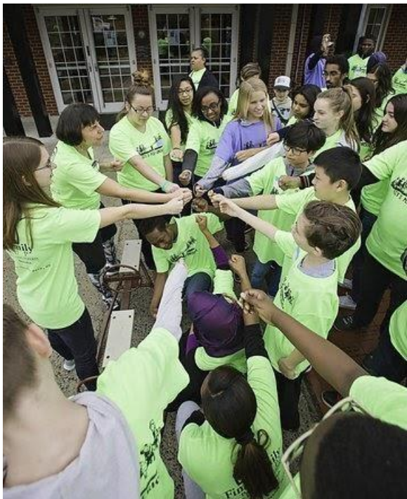
Волонтери LPA на Зимовому Дні Гри 2017.