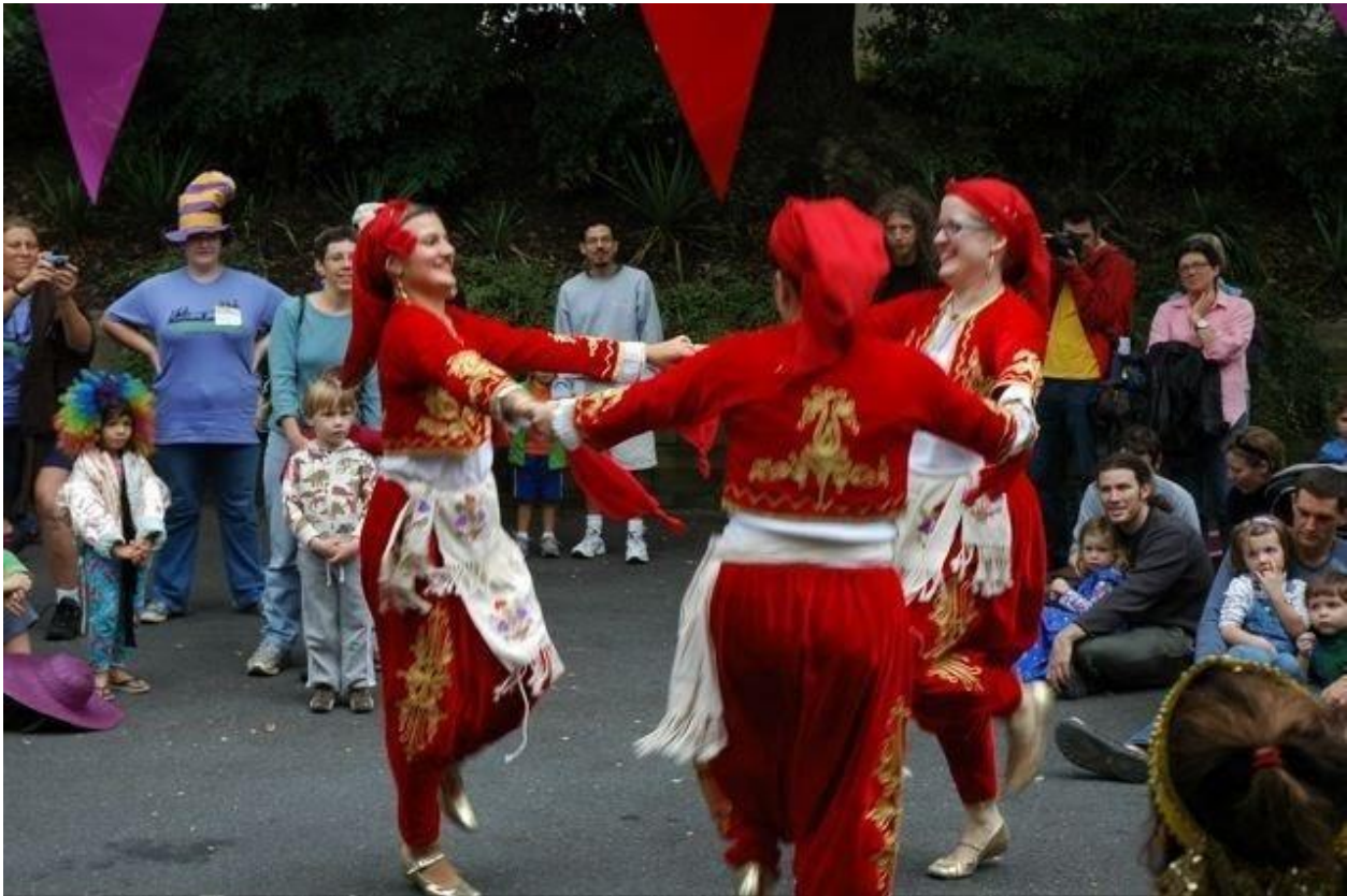
Турецькі танцюристи на першому Дні Гри у 2009 році.