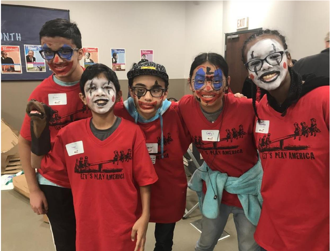
Підлітки-волонтери на Зимовому Дні Гри 2020