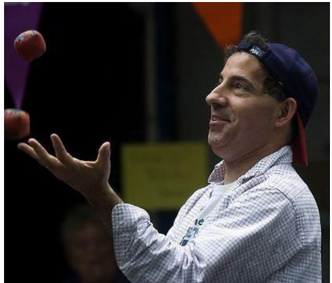
Сенатор штату Меріленд Джеймі Раскін жонглює на першому

Живі інтерактивні розваги є чудовим прикладом гри, в якій може брати участь уся спільнота, чи то живий гурт, який грає пісні, з якими кожен може підспівувати та танцювати, чи виконавець, який запрошує до участі публіку. Подумайте, чи може ваш бюджет дозволити компенсацію вашим артистам, чи ви шанобливо попросите їх дарувати свої таланти безкоштовно.