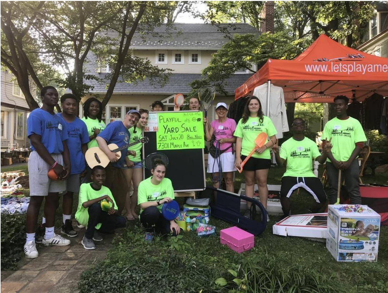
2019 Грайливий дворовий розпродаж