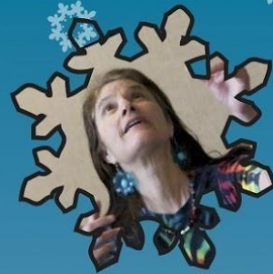
Candace Wolf International Storyteller