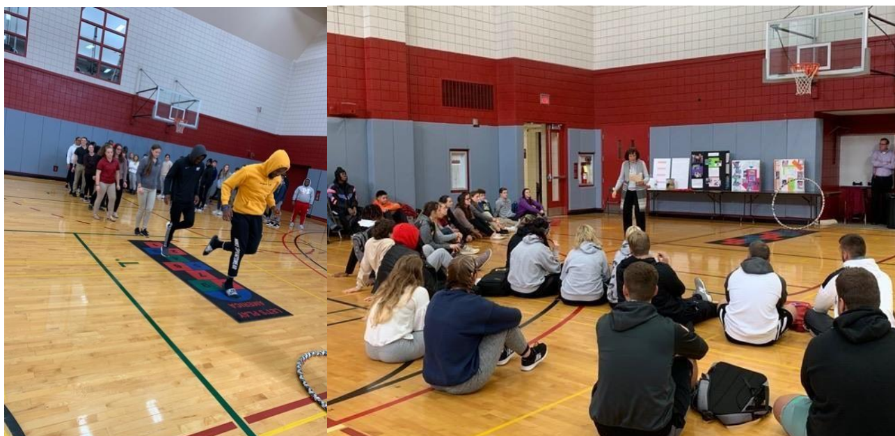
Листопад 2019: Пет розповіла про гру та провела кілька ігрових занять для студентів Пенсільванського університету Індіани. Пет є випусницею 1980 року.

Подумайте про людей із вашої спільноти, які відвідають ваш День Гри. Наприклад, якщо це День Гри для дошкільного закладу, ви проводите його лише для дітей чи для дітей, сімей та персоналу? Хто планує ваш ігровий день? Персонал дошкільного закладу, працівники та батьки-волонтери та/або будь-хто інший? Добре мати пару цілей на день гри разом із очікуваною кількістю відвідувачів. Чи плануєте ви збирати гроші через цей захід? Якщо так, то скільки б ви хотіли отримати?