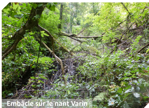
Embâcle sur le nant Varin

Pour des raisons d'intérêt général, la collectivité peut intervenir en propriété privée pour réaliser des travaux d'entretien sur les cours d'eau. Ces travaux doivent être préalablement déclarés d'intérêt général par arrêté préfectoral suite à une enquête publique.