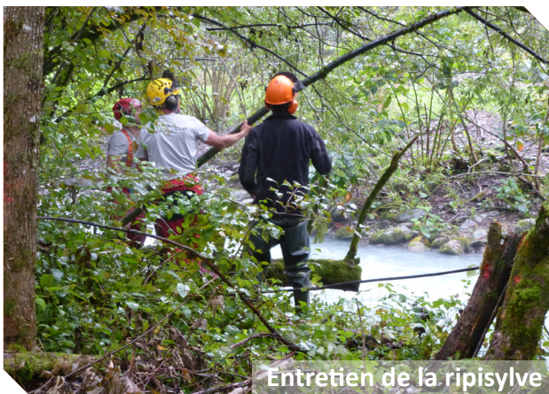
Entretien de la ripisylve

Les opérations d'entretien des boisements de berges peuvent être effectuées directement par les riverains, sans accord, ni déclaration préalable auprès de la Police de l'eau.